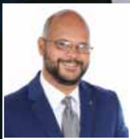
Por: Henry Valenzuela