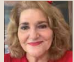
Por: Jacqueline Chamoun

Así como la imagen sirve para recordar el «océano