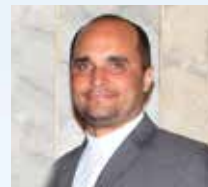
Por: RP Robert Brisman