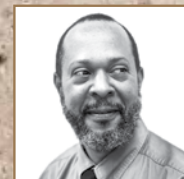
Por: Carlos Rodríguez