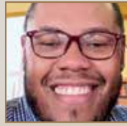
Por: Juan Pascual