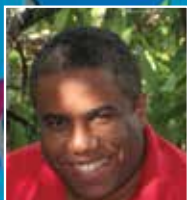
Por: Ángel Gomera