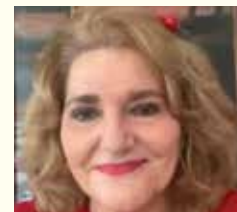
Por: Jacqueline Chamoun Cursillo # 490

María, en cambio, se pregunta cómo se cumplirán las Palabras del ángel. Su actitud es de una fe que busca comprender.