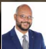
Por: Henry Valenzuela