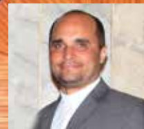
Por: RP Robert Brisman