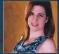
Por: Leonor Asilis