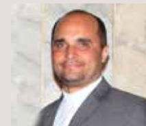
Por: RP Robert Brisman

Y es que, para este cardenal, ningún cristiano debe de irse o andar por lo que se ha llamado «la libre». Dijo: «El primer destinatario de la revelación de la verdad de Dios no es