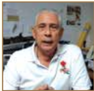
Por: Uto Sánchez