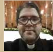
Arquidiócesis de Santo Domingo. Cursillo de Cristiandad, año 1994