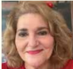
Por: Jacqueline Chamoun B. Cursillo 490