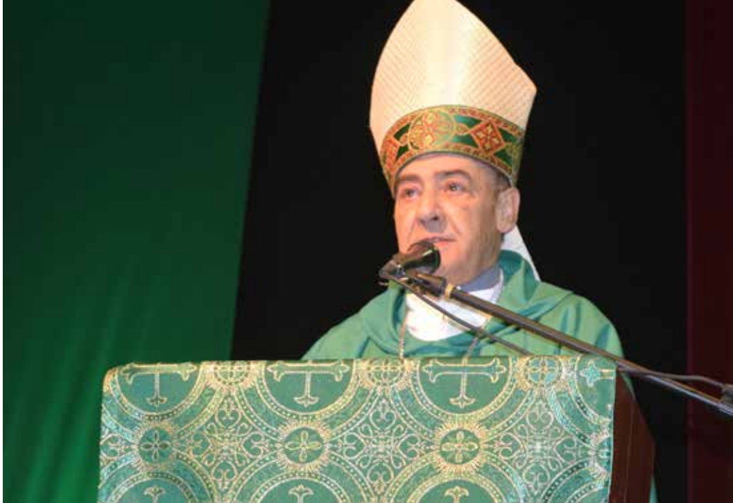
+Mons. Amancio Escapa O.C.D.

Una de las características del jubileo de la misericordia fue que ciertas parroquias se declararon Puertas Santas, y al traspasar estas puertas se